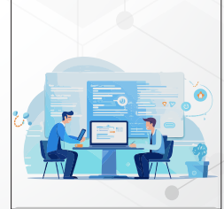
الاستشارات الفنية Technical Consulting