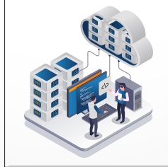
حلول الشبكات Networking Solutions